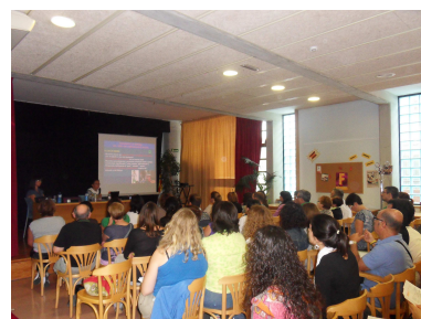
Conferència a Igualada. "Com detectar els TEA"

En l'àmbit de recerca s'ha posat en marxa el projecte Special QR (SPQR) . L'objectiu és desenvolupar un software per a mòbils que permeti l'accés a codis QR (estàndard de comunicació per a persones amb dificultats de comprensió del llenguatge oral). Aquest projecte es desenvolupa en col·laboració amb Bj Adaptaciones i la Fundació Orange, entitats amb les que s'ha signat un conveni.